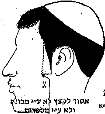
איסור לקצץ לא עיי מכונה ולא עיי מספרים

לאחרונה, החלה אופנה חדשה של הצרת עובי רוחב פאות הראש בצורות שונות, ובוה נכשלים באיסור "הקפת פאת הראש" וכדעת השו"ע [יורה דעה סימן קפ"א סעיף טו] שאיסור הקפת הפאות הינו בכל רוחב פאות הראש, ואסור לתלוש אפילו שתי שערות בכל עובי שיעור מקום הפאות. (וכמבואר שם בביאור הגר"א ס"ק י"ד בשם מרן הב"י).